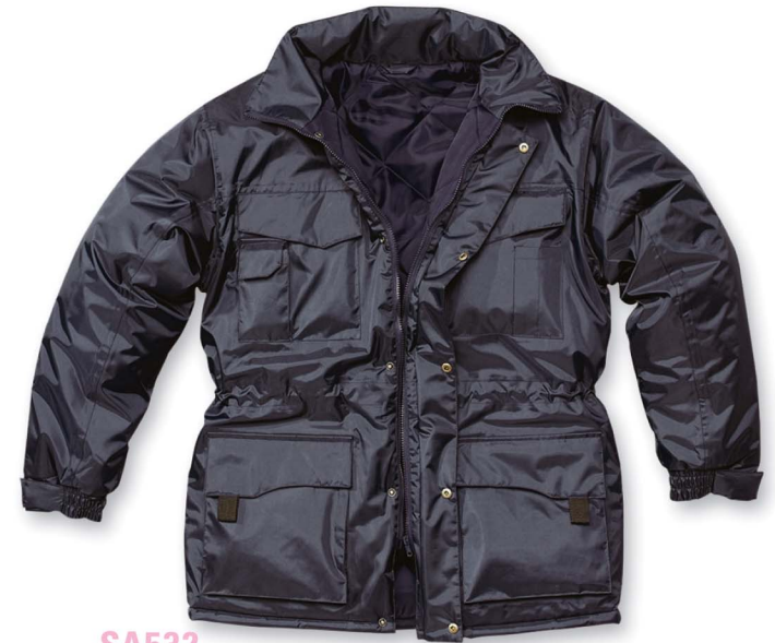
SA532 GIACCONE imbottitura in poliestere , fodera in ny trap chiusura con cerniera e con bottoni varie tasche esterne ed interne cappuccio a scomparsa -coulisse in vita taglia: M - L - XL - XXL ( a richiesta ) materiale: nylon / PVC