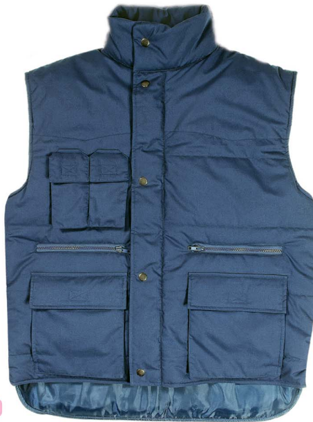
SA540 GILET imbottito - multitASCHE chiusura con cernieri e bottoni taglia: M - L - XL - XXL ( a richiesta ) materiale: poliestere