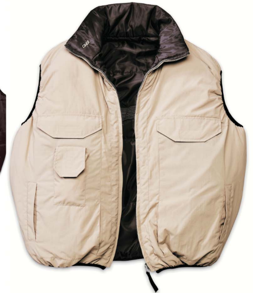
SA543 GILET DOUBLE FACE gilet reversibile - chiusura con cerniera varie tasche esterne ed interne inserti retroriflettenti nella parte interna taglia: M - L - XL - XXL ( a richiesta ) materiale: nylon