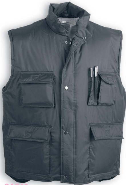
SA548 GILET MULTITASCHE Bomber smanicato imbottito Chiusura con zip e coulisse Tessuto idropellente nylon taglia : M - L - XL - XXL (a richiesta) materiale: nylon